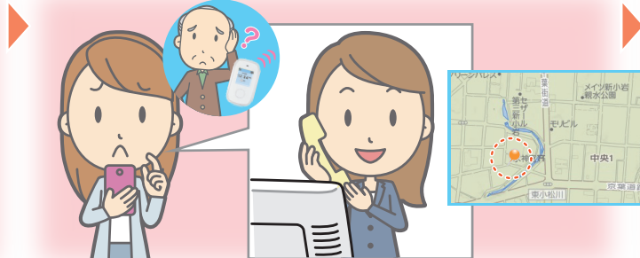
位置情報センターに探索依頼 オペレーターが位置情報をご案内