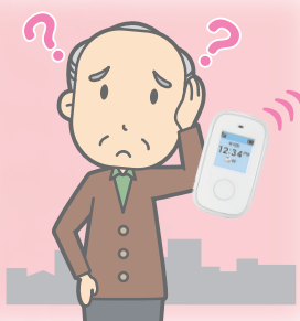
介護者が徘徊に気付く