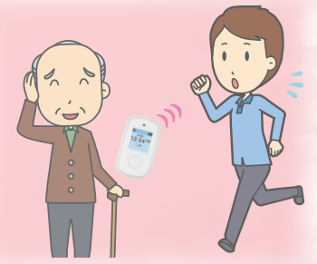
位置情報を頼りに保護

※端末の電源が入っていない場合や、ソフトバンク社の通信エリア外では探索できません。 ※電波を遮断する建物内や地下、山間部など、電波状況によっては、位置情報に誤差が生じたり、探索できない場合があります。 ※保護の代行は行っていません。